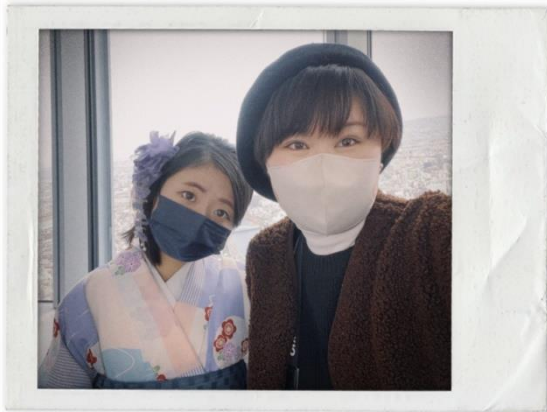
與地理學科陳同學一起去晴空塔遊玩