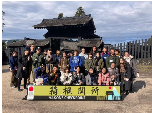
留學生箱根研修旅行大合照