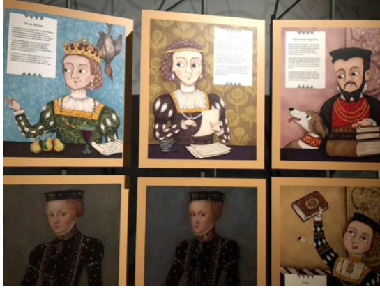
土庫 Turku 城堡中特別為孩童設計的展覽