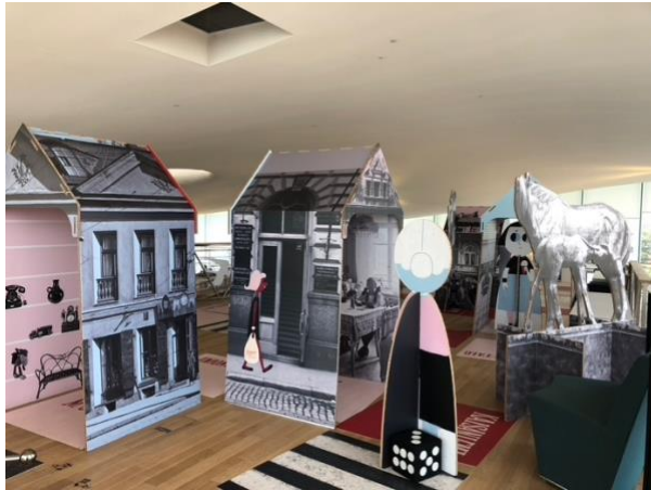
圖書館內設計給孩童的遊樂區