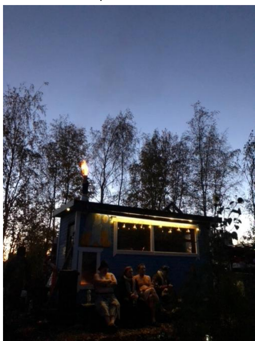
赫爾辛基近郊的湖邊桑拿小屋