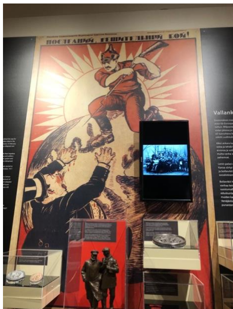
參觀坦佩雷 Tampere 列寧博物館