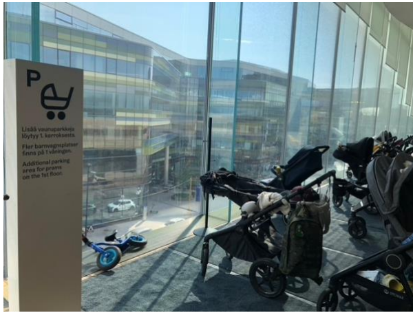
館內有停放嬰兒車的空間